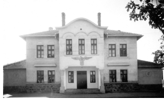
Сл. 4. Зграда Соколског дома у којој је радила Омладинска библиотека, половина 20. века

а саграђена је 1932. године. У почетку је то била једноспратна грађевина, богате фасадне декорације, чији се првобитни изглед губи 1970. године, након дограђивања спрата.