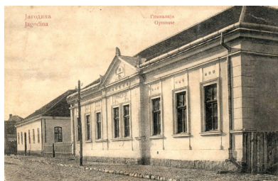
Сл. 2. Зграда Гимназије у којој је радила Јавна библиотека у Јагодина, почетак 20. века

и револуционарно усмерене струје Уједињене омладине српске. Од 1872. године мењају се прилике у раду Читалишта. Власт је почела да обраћа већу пажњу на чланове и на организовање скупова. То нарочито долази до изражаја кад се у Јагодина формира прва опозиција, што је последица рада Светозара Марковића, који је у Јагодина стекао присталице и подршку међу млађим и слободоумнијим грађанима. То за последицу има премештаје млађих чланова, потом и изостајање општинске помоћи раду Читалишта, а напослетку и престанак рада. 5 У прегледу новчаног стања Читалишта, за 1874. годину, види се да је читаоница у Јагодина почетком године имала већи издатак од прихода. 6 У извештају Округног начелника, из 1875. године, наводи се да је Читалиште престало да ради јануара 1874. године, пошто је у његовим просторијама смештен новоосновани трећи разред Реалке. 7 Читаоница је набављала листове: Будућносћ , Јавносћ , Учишељ , Школа , Врзино коло и једини страни лист Засјава . 8 Само постојање Читалишта значило је основ за развијање библиотечке делатности, која се три деценије касније утемељује под окриљем Библиотеке, а Указом краља Петра I Карађорђевића основана је 27. априла 1909. године.