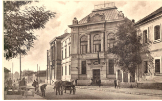
Сл. 3. Зграда Првостепеног суда у којој је радила Народна књижница и читаоница, почетак 20. века

600 књига и 5 часописа. 17 Марта 1930. године Удружење је организовало 73. јавно предавање, које је одржао директор Учитељске школе др Драгољуб Петровић, 18 са темом Ми и Французи . 19