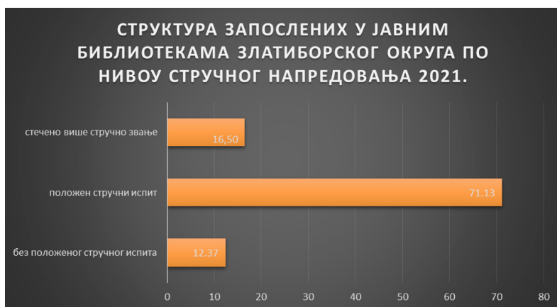
Слика 3. Структура запослених у Златиборском округу 2021. по нивоу стручног напредовања

Подаци Матичне службе НБУ за претходну годину говоре да је у народним библиотекама Златиборског округа нешто више од 71% запослених положило стручни испит, а 16,5% стекло више стручно звање, којих је највише у ужичкој библиотеци (Слика 3). 35