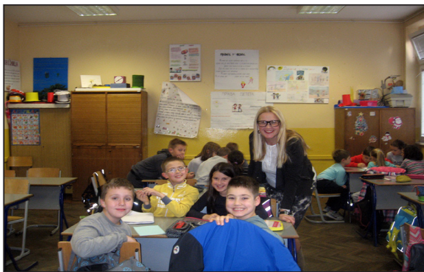
Слика 1

Радионица „Куце на продају – У разликама је наше богатство” намењена је ученицима III разреда (слике број 1 и 2). Кроз причу Дена Кларка 10 о дечаку који купује куче које има проблем са ногом, ученици увиђају вредносне чиниоце, постојање разлика међу људима, превазилажење и супротстављање предрасудама и дискриминацији. Осим тога, развијају самосвест, самопоштовање и уважавање других. Истицањем најосновнијих људских вредности – једнакости и равноправности, ученици су правилно уочили и разумели важност прихватања особа којима је помоћ најпотребнија.