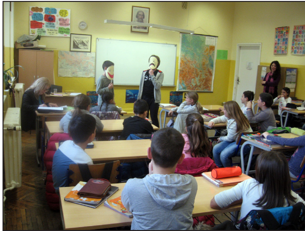
Слика 3

оница „Како видим себе” (слика број 3). Кроз приказ различитих емотивних стања и ставова појединаца, ученици су доживели и схватили вредности толеранције и недискриминације, увидели потребу превазилажења и супротстављања предрасудама и стереотипима. Уочили су различите погледе на свет дечака Плачка и Смејачка и у паровима, глумећи ситуације из свакодневног живота, приказали како свако од нас може утицати на формирање сопственог афирмативног става о животу и свету који нас окружује.