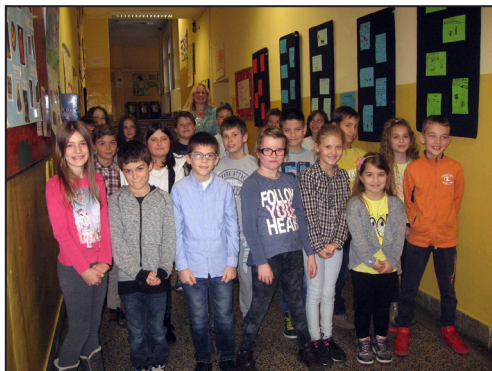
Слика 4

рада ученика, ставовима и илустрацијама, изазивају пажњу осталих ученика школе, наставника и родитеља. Библиотекари су закључили да су радионице код ученика развиле и креативне и социјалне компетенције, које их инспиришу на даље интеграције и самоостваривање кроз учешће у осталим активностима школе.